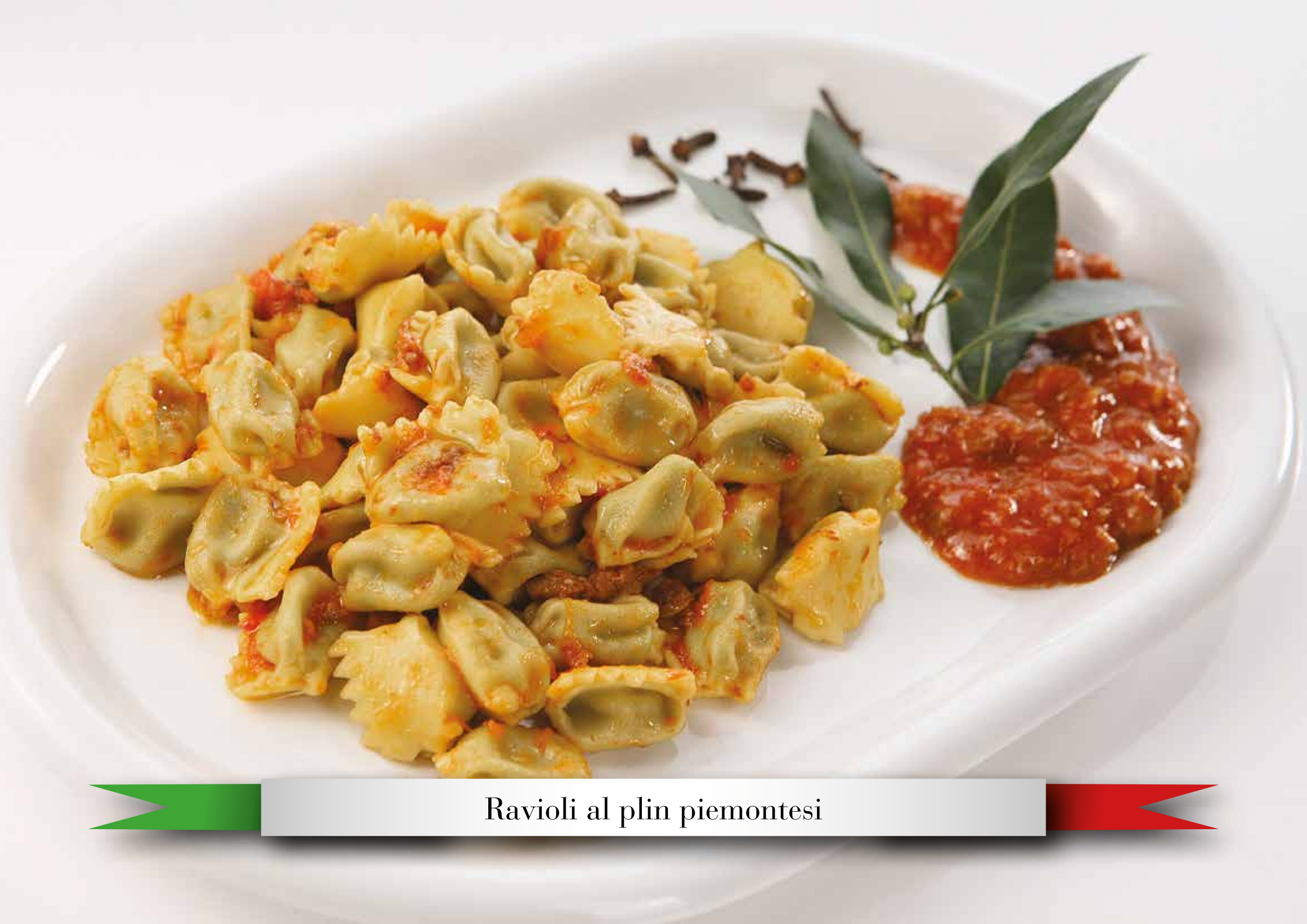
Ravioli al plin piemontesi