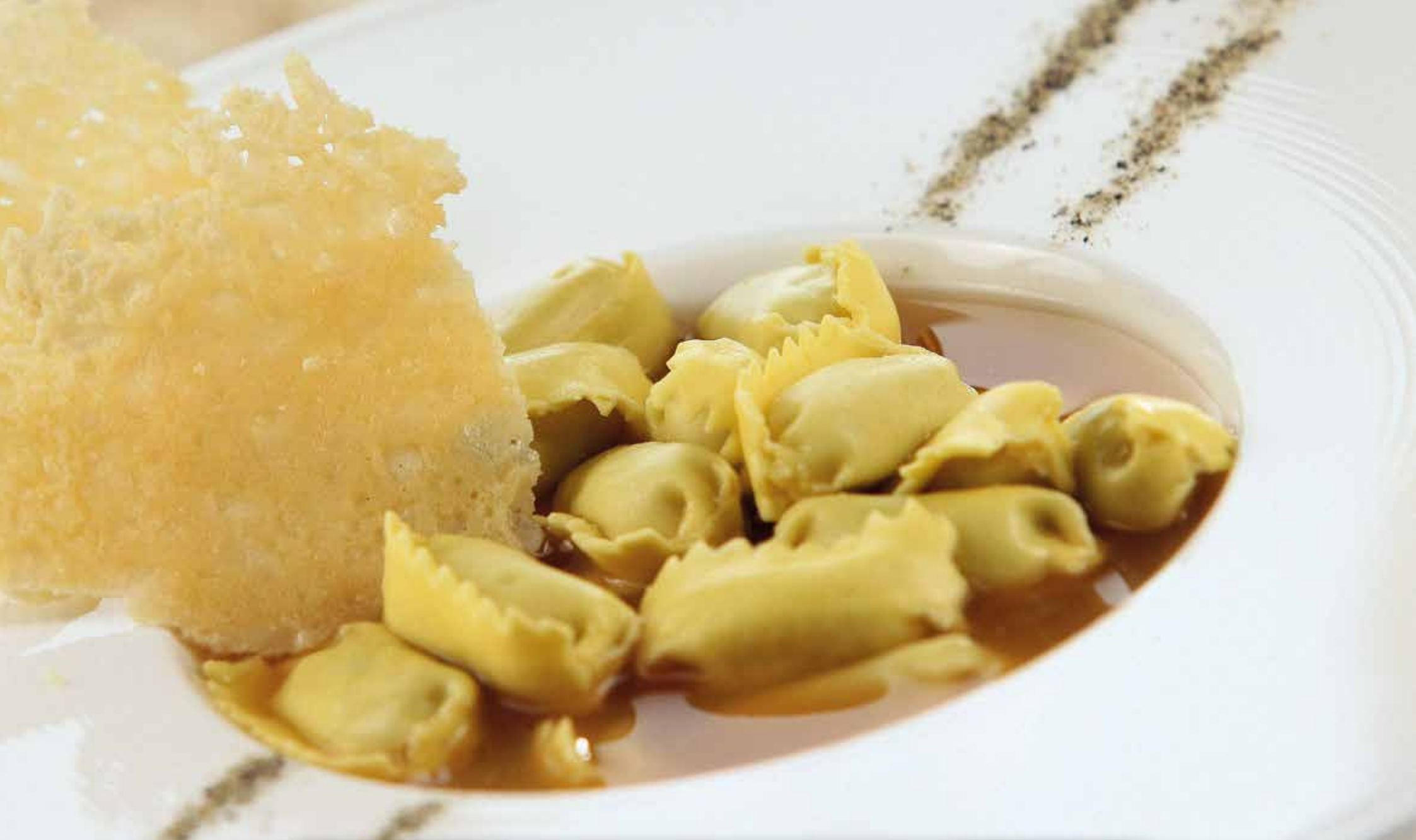
Cannoncini al foie gras