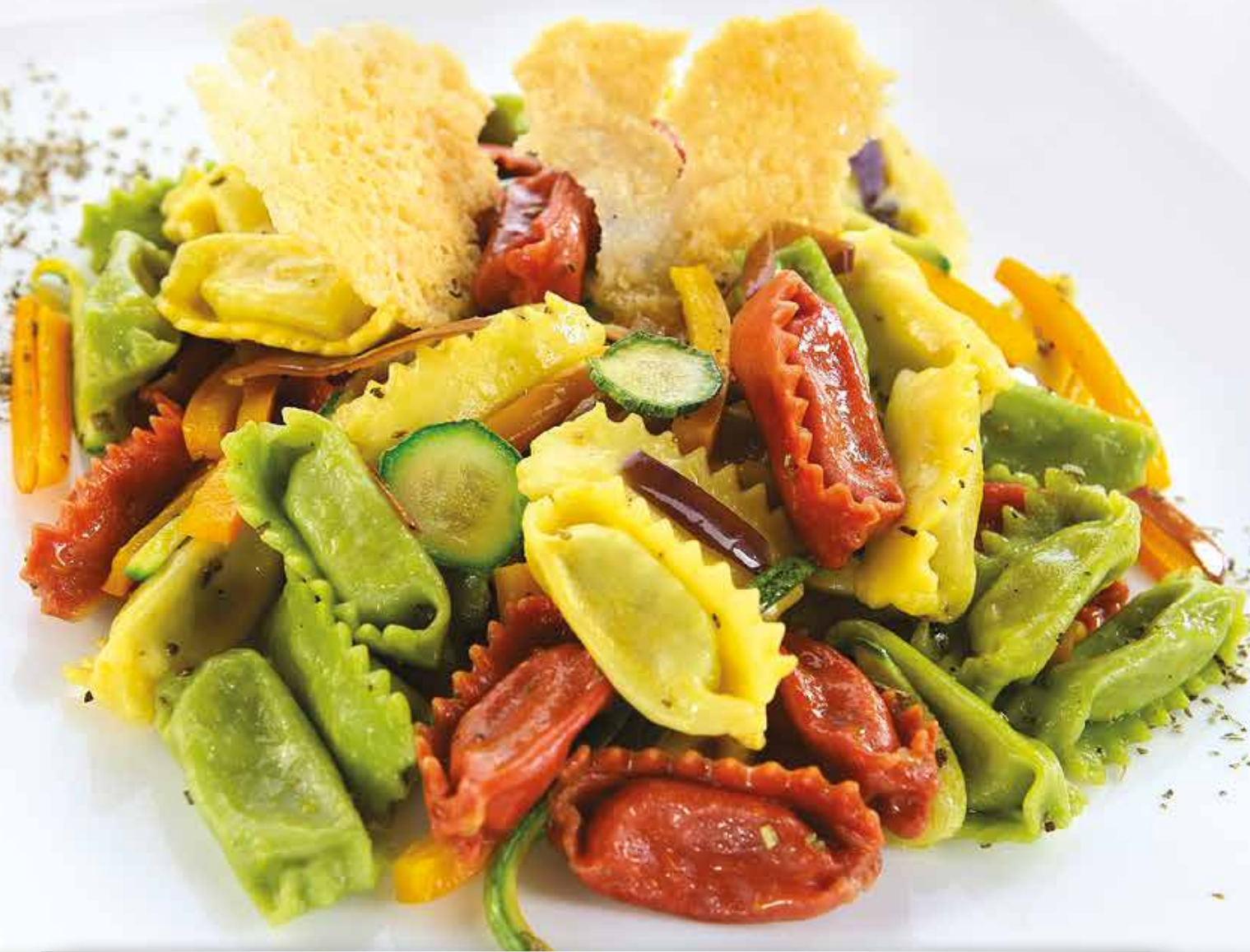
Cannoncini tricolore porri e salsiccia