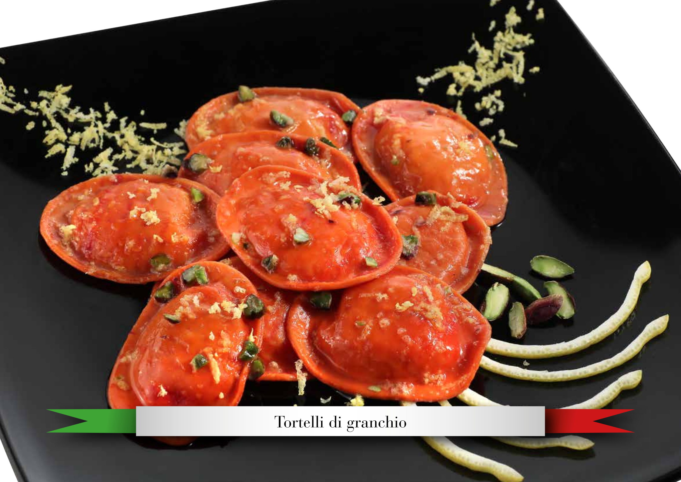
Tortelli di granchio