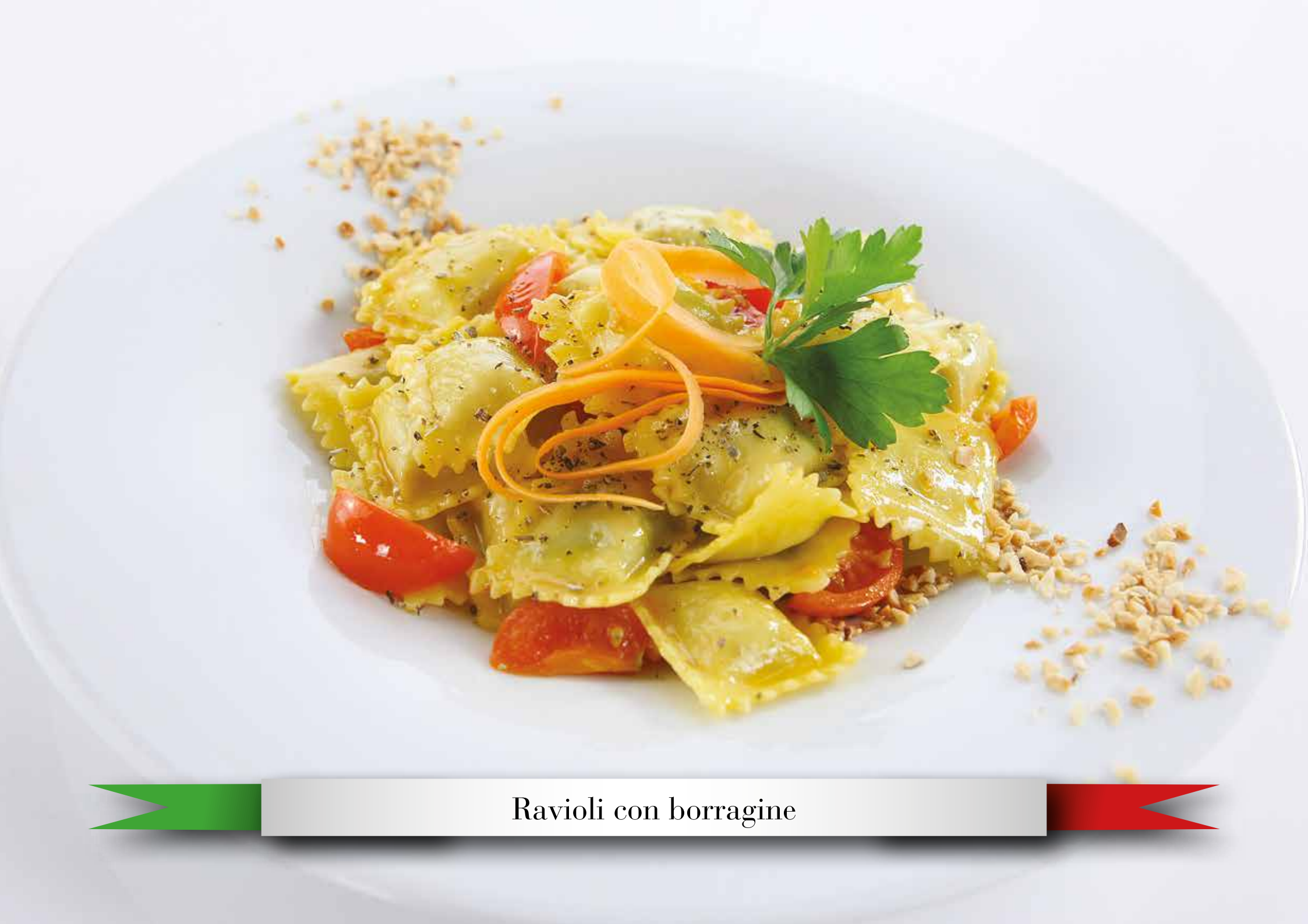
Ravioli con borragine