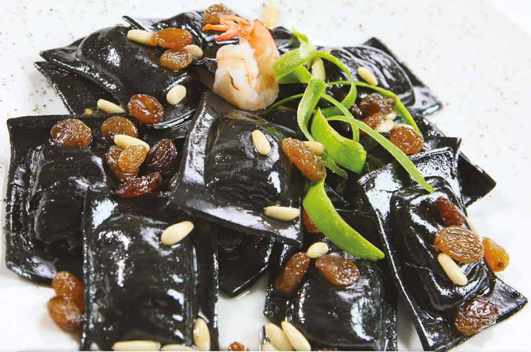
Sombras al branzino con pasta al nero di seppia