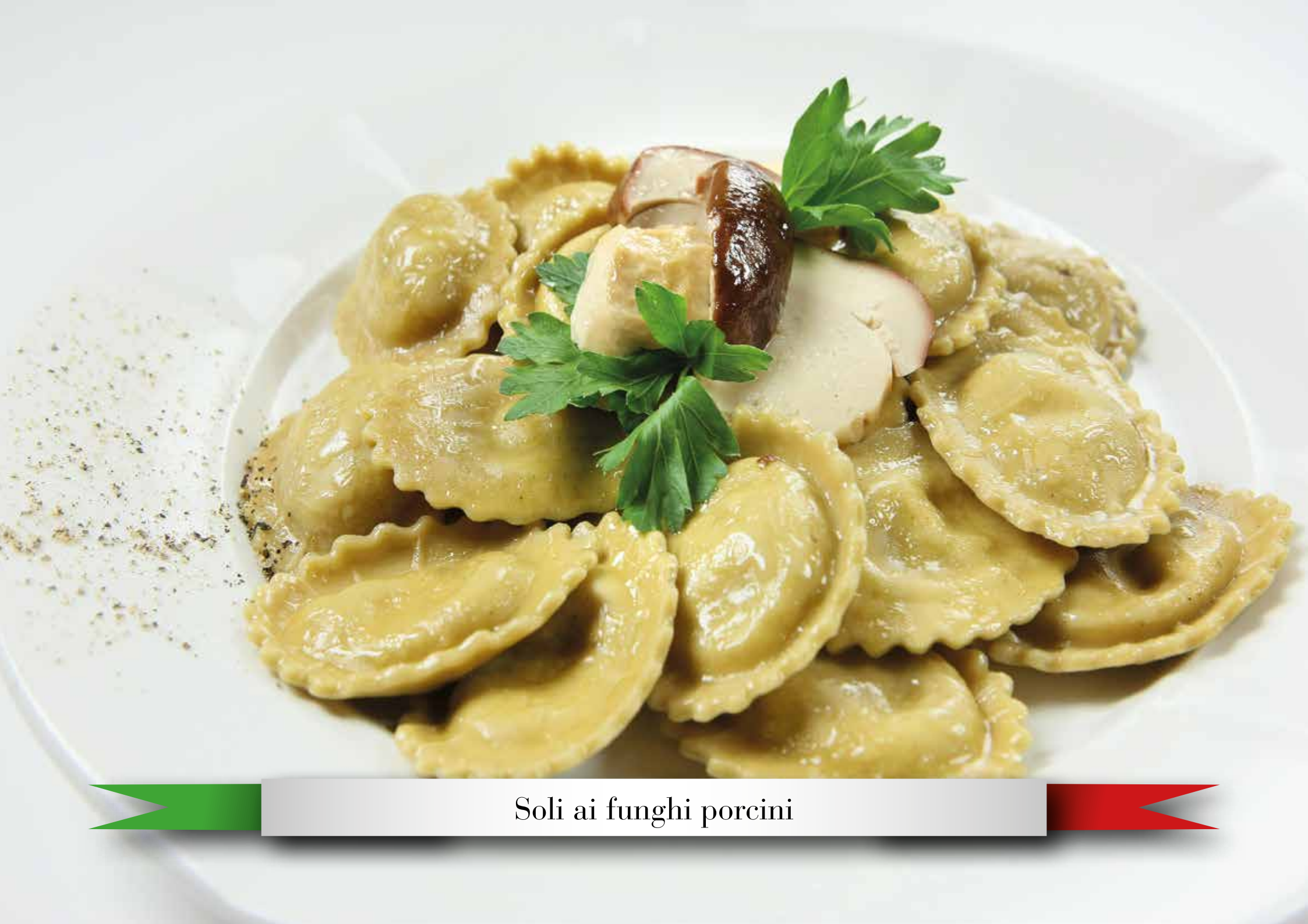
Solli ai funghi porcini