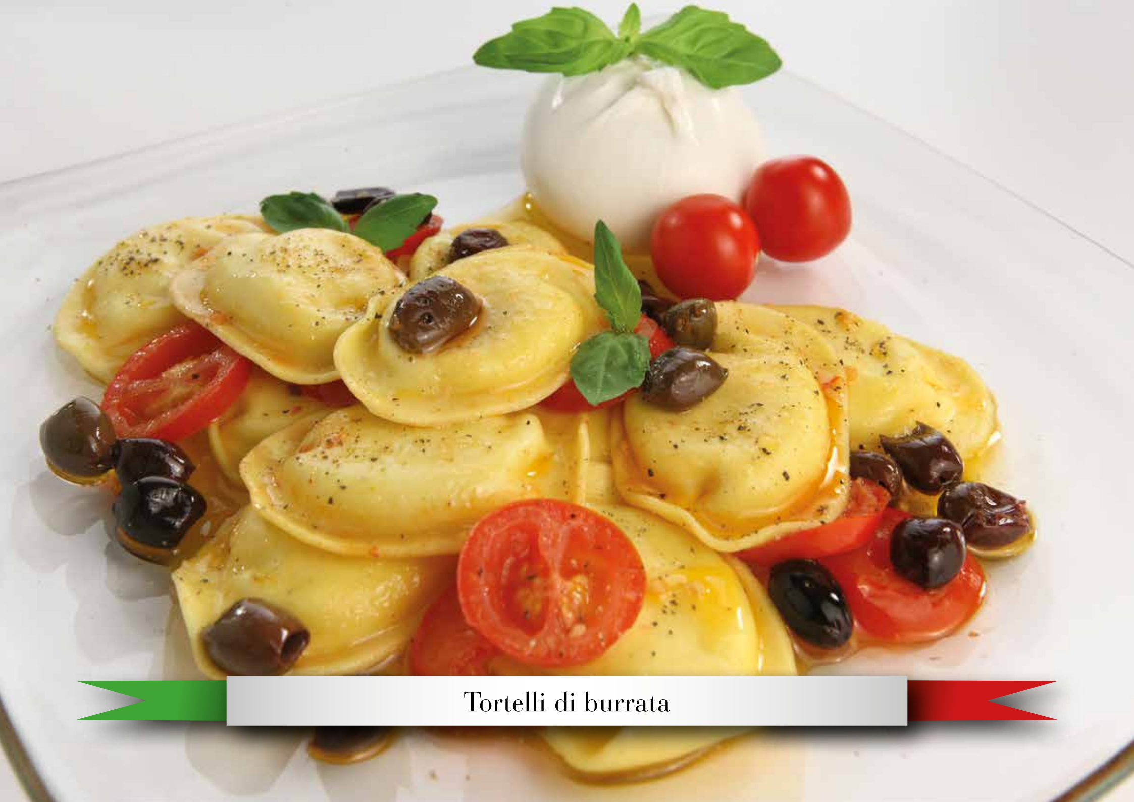
Tortelli di burrata