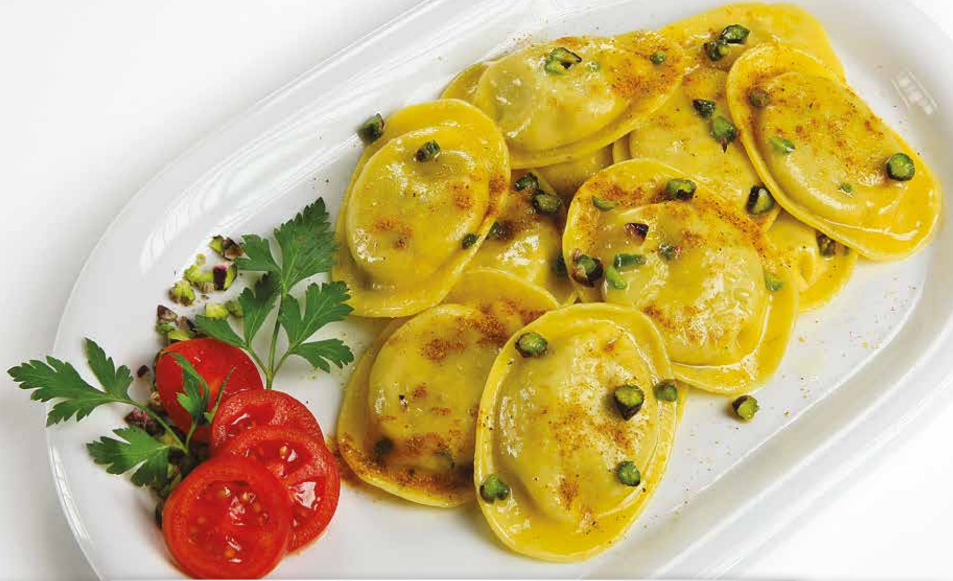
Tortelli di Persico