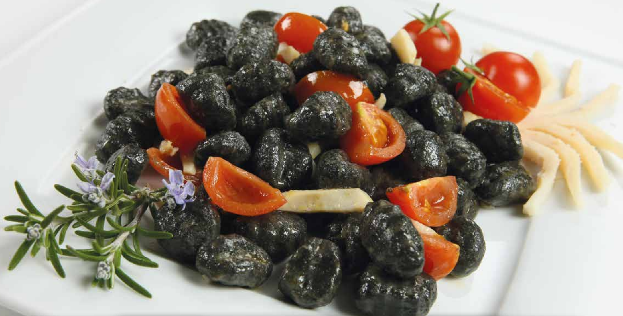
Gnocchi al nero di seppia